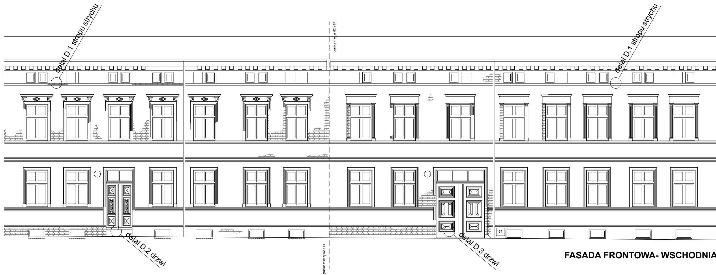
FASADA FRONTOWA- WSCHODNIA